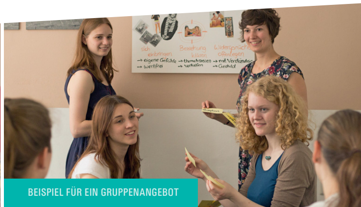
BEISPIEL FÜR EIN GRUPPENANGEBOT

Mit Ihrer Spende tragen Sie dazu bei, dass Jugendliche und junge Erwachsene weiterhin von unserer Arbeit profitieren.